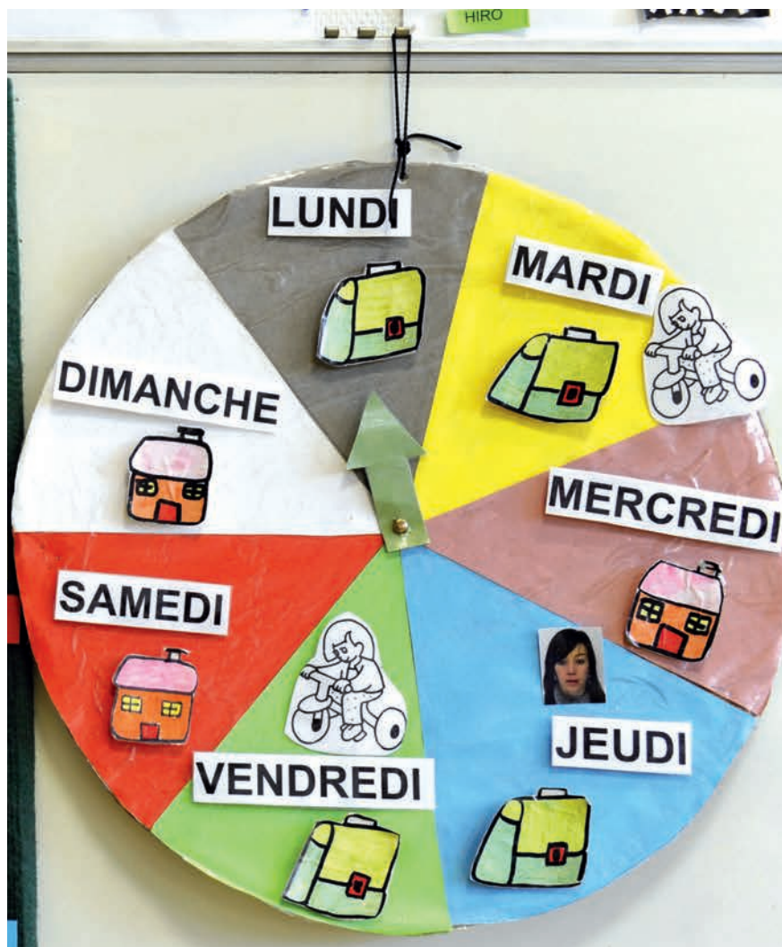
Le dimanche (en blanc) : une journée pas comme les autres !

— C'est effectivement très difficile. Le but de l'année liturgique consiste à nous associer à la vie de Jésus Christ, à recevoir le Salut. Il nous rend participants de sa vie divine, une vie éternelle ! C'est déjà entrer dans un autre temps. L'année liturgique commence avec le temps de préparation à Noël, la naissance du Christ parmi nous. Elle a pour centre Pâques, sa mort et sa résurrection.