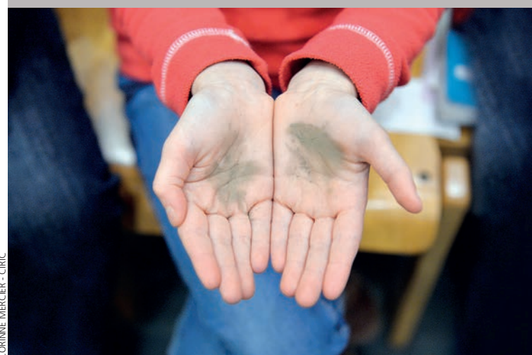
CORINNE MERCIER - CIRIC