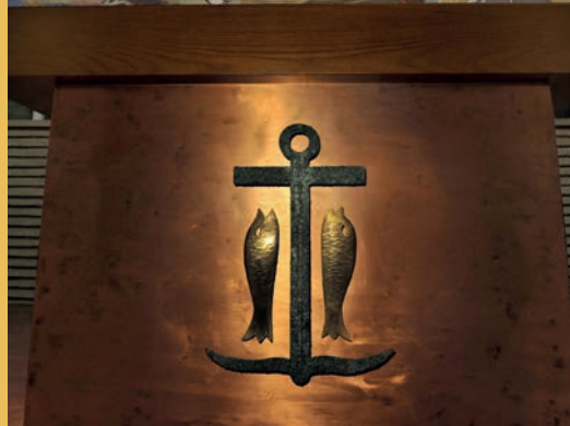
Autel de l'église Saint-Jacques à Neuilly-sur-Seine.

Mais pourquoi une ancre au cœur d'une église bien éloignée de tout rivage ? L'ancre était un signe de reconnaissance pour les premiers chrétiens. Parfois augmentée d'une barre transversale, et accompagnée de poissons évoquant les nouveaux convertis, elle rappelait la forme de la croix. En même temps, comme le dit la lettre aux Hébreux (6, 19-20), elle représente le solide ancrage de l'espérance chrétienne dans le Royaume du salut grâce à Jésus qui nous y précède. Celle que l'on voit ici s'inspire d'une ancre gravée dans la catacombe de Priscille à Rome au IIIe siècle, et manifeste ainsi la continuité de la foi au Christ.