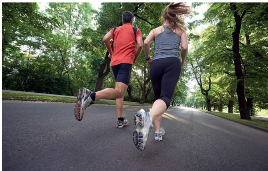
Un peu de course à pied, pour garder l'équilibre ?...

Second facteur de motivation : le maintien d'une vie sociale entre étudiants. Quel que soit le contexte, elle les aide à garder le moral. L'an passé, l'isole-