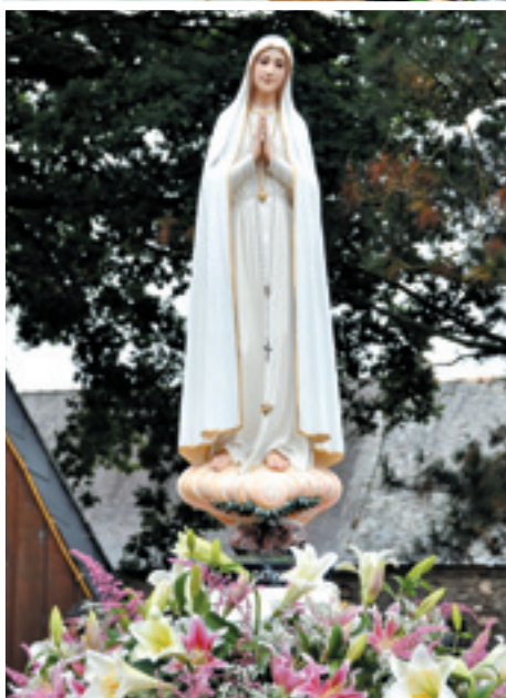
A l'Assomption, l'Eglise fête l'élévation de la Sainte Vierge au ciel après sa mort.

telle, l'expression des participants est très explicite : «Je fais la Madone» . Porcaro, ce sont des concerts, une balade dans les environs, un forum, mais ce sont aussi l'oratoire où les motards passent tout au long du week-end et les célébrations. La cérémonie dédiée aux motards défunts de l'année, qui démarre le week-end, est un moment particulièrement émouvant ; tous les noms qui m'ont été confiés tout au long de l'année sont alors cités. Beaucoup de motards viennent en famille, sur plusieurs motos ou en side-car, certains ramènent aussi leur chien. Ici, tous les milieux se côtoient