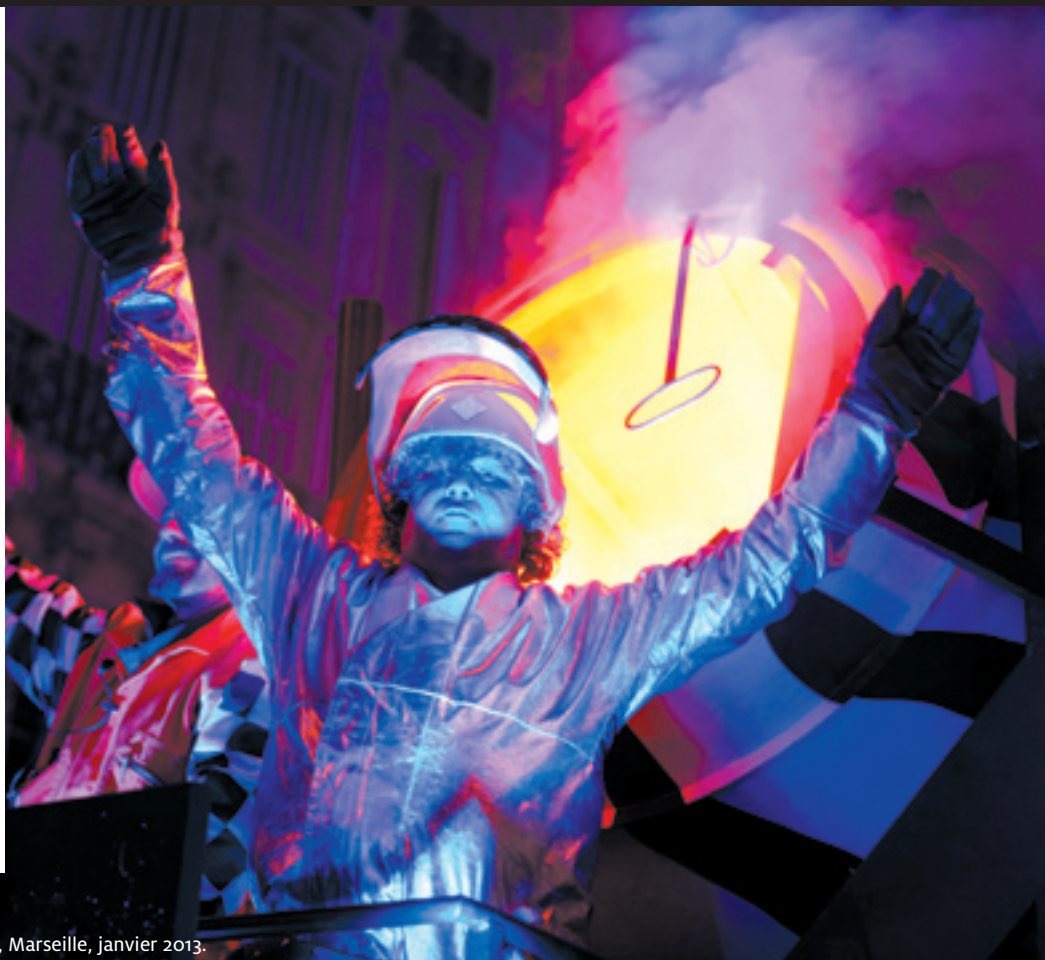
Parade des Lumières, Sud Side, Marseille, janvier 2013.

Tout le programme des festivités sur : www.mp2013.fr