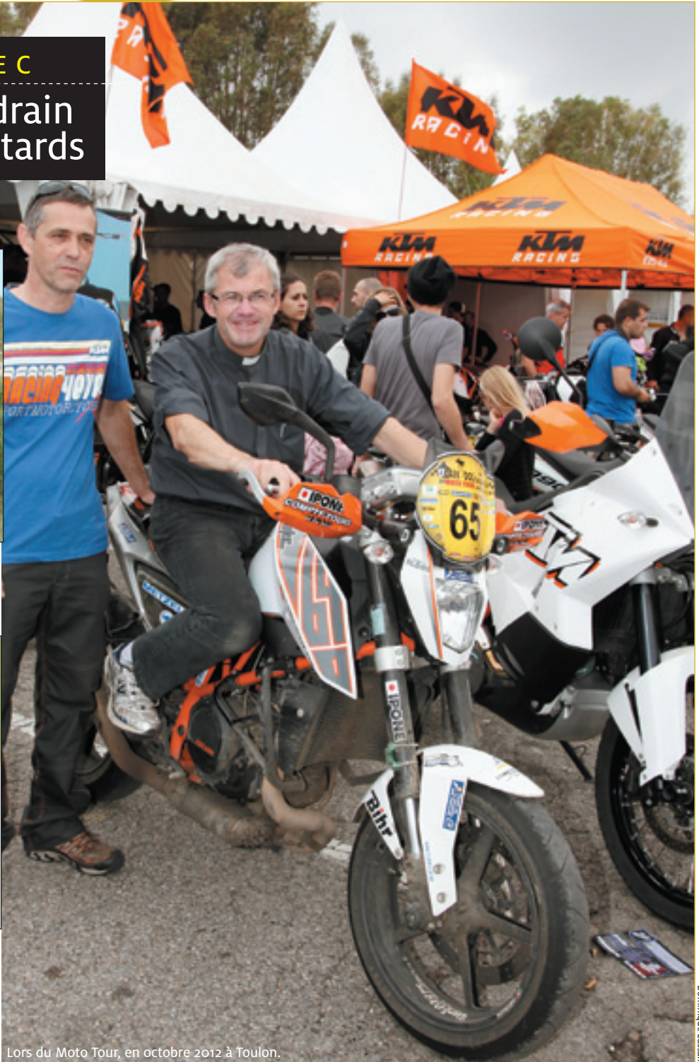
Lors du Moto Tour, en octobre 2012 à Toulon.

PAGE 8 : Il était une foi... Jérémie, prophète et messager d'espérance