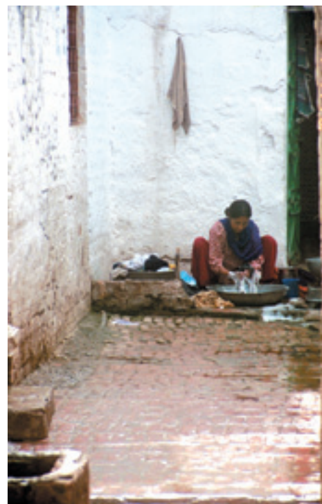
A Peshawar, au Pakistan, les chrétiens, petite minorité, ont fait l'objet à plusieurs reprises ces dernières années de persécutions.

* Ainsi qu'on peut le voir au Pakistan, les musulmans chiïtes en minorité sont persécutés par leurs frères sunnites. Il n'y a pas que les chrétiens (1% de la population) qui ont des problèmes dans ce pays.