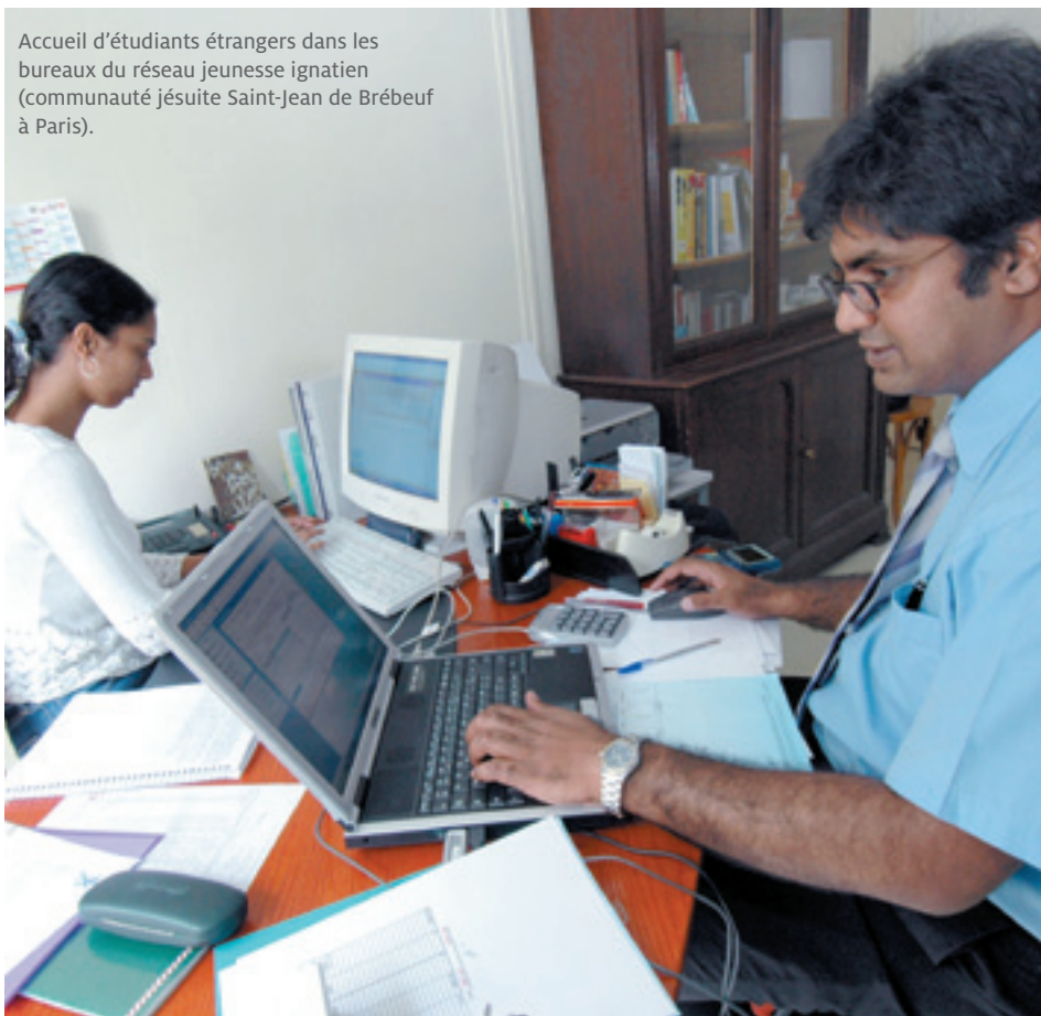
Accueil d'étudiants étrangers dans les bureaux du réseau jeunesse ignatien (communauté jésuite Saint-Jean de Brébeuf à Paris).