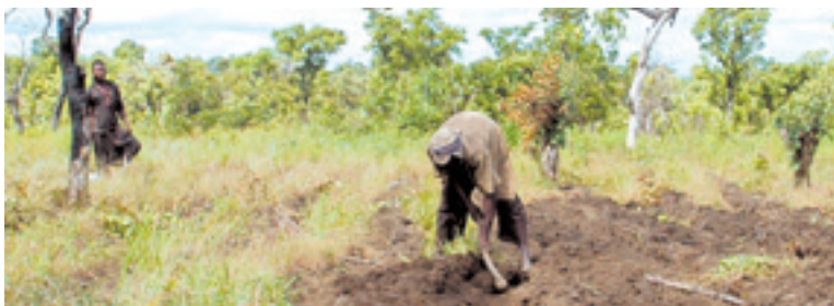
Bayard Service Édition

Pour aller plus loin : www.cirad.fr et ruralinfos.org