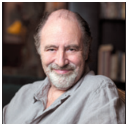
PAGE 16 Michel Delpech : «Cette rencontre avec Dieu fut comme une deuxième naissance»