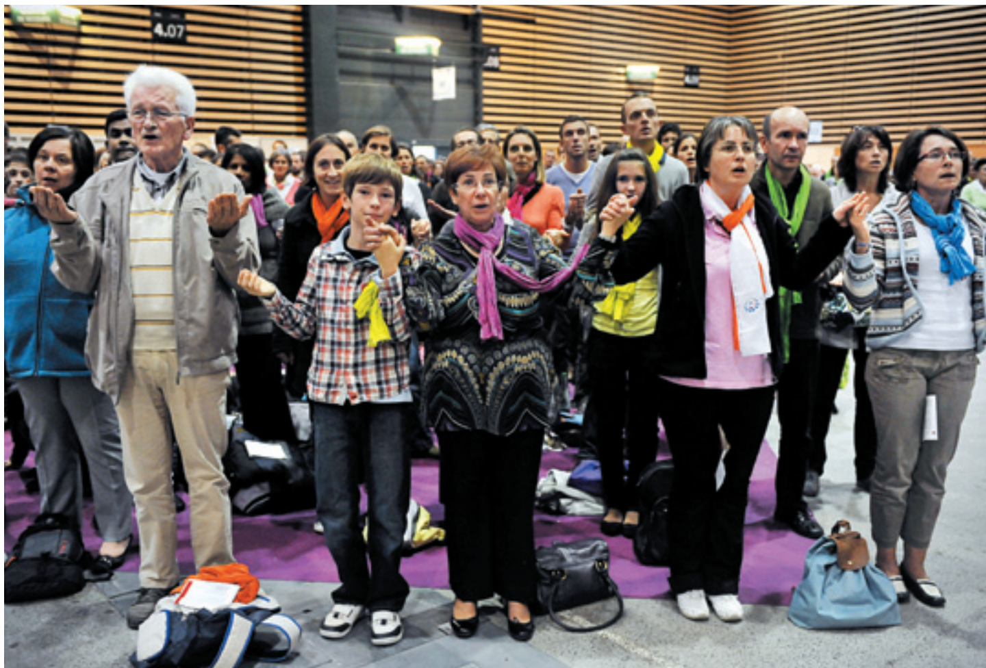
Le Notre Père lors de la célébration de la fête diocésaine de Lyon en 2012.