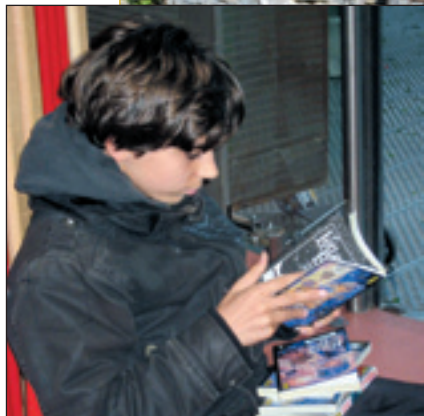
PAGE 6 La lecture : des histoires à partager entre enfants et parents

Une équipe de scouts L'engagement, une belle expérience