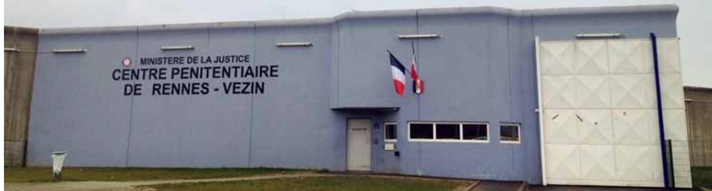
La vieille prison Jacques-Cartier a été remplacée, en 2010, par le nouveau centre pénitentiaire de Vezin-le-Coquet (notre photo), où 200 caméras ont pris, en partie, le relais des gardiens.

Mais la religion n'amorce que rarement les dialogues. «Nous rencontrons tous ceux qui le demandent, sans faire de prosélytisme», précise Christian. Beaucoup viennent nous voir au départ parce que nous sommes leur seule possibilité de contact.» Une réalité d'autant plus incontournable qu'à la centrale de Vezin-le-Coquet les gardiens ont été remplacés par une petite armée de plus de deux cents caméras. La rencontre prend alors une tout autre valeur... «Très souvent, ils nous parlent de leur quotidien, de ce qu'ils ont vu à la télé, des difficultés qu'ils rencontrent. On est là pour les écouter, comprendre ce qu'ils vivent, sans les juger, mais sans pour autant excuser ce qu'ils ont fait.»