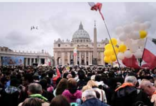
Jean-Mathieu Gaudier / BSE/CIRIC

27 avril 2014 : depuis la via della Conciliazione à Rome, lors de la cérémonie des canonisations des papes Jean Paul II et Jean XXIII.