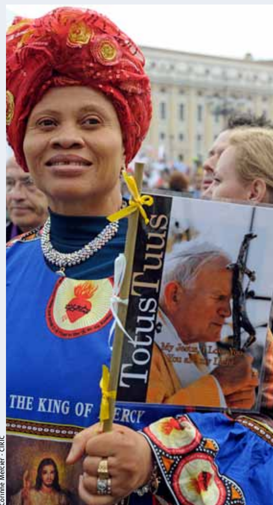
1 er mai 2011 : pèlerin lors de la messe de béatification de Jean Paul II, place Saint-Pierre à Rome.

«N'ayez pas peur !» exhorte le premier pape polonais, le 22 octobre 1978. Après le long pontificat de Paul VI (1963-1978) et la mort subite de Jean-Paul Ier, Jean Paul II donne un souffle nouveau à l'Église catholique. Bien sûr, les dernières années de son existence, marquées par la maladie de Parkinson, furent douloureuses et exemplaires. Mais le pape multiplia les records durant vingt-sept ans, le troisième pontificat le plus long de l'histoire chrétienne. Quatorze encycliques ; 104 voyages lui permettant de visiter 130 pays, soit 29 fois le tour de la Terre ; des milliers d'interventions publiques, des millions de fidèles rencontrés... Et une volonté indéfectible de conduire les croyants dans les pas des saints et bienheureux innombrables de l'histoire chrétienne. Plus que tous ses prédécesseurs réunis durant les quatre derniers siècles, Jean Paul II a béatifié 1 338 bienheureux et canonisé 482 saints,