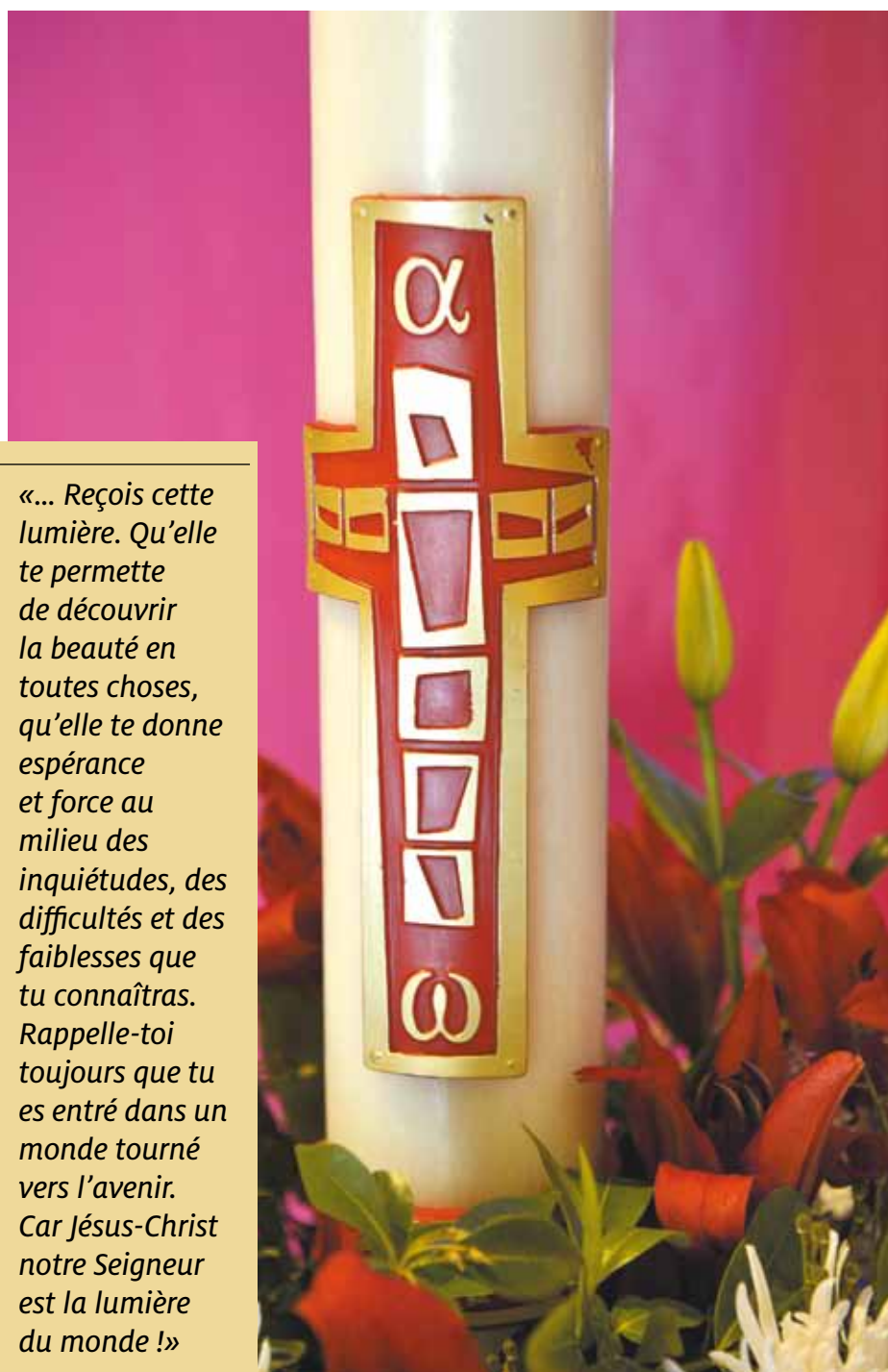
Corinne Mercier - Cifre