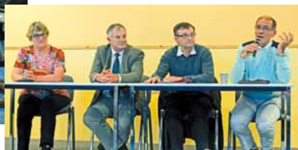
La table ronde de l'Assemblée générale.