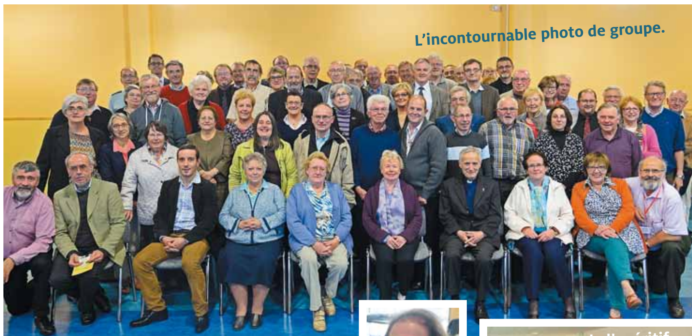
L'incontournable photo de groupe.