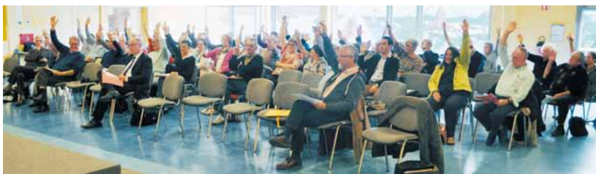
L'approbation des rapports moral et financier.