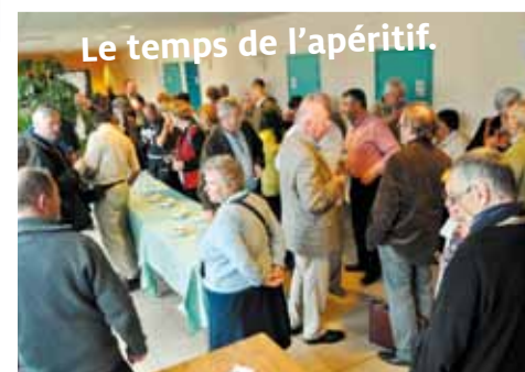
Le temps de l'apéritif.