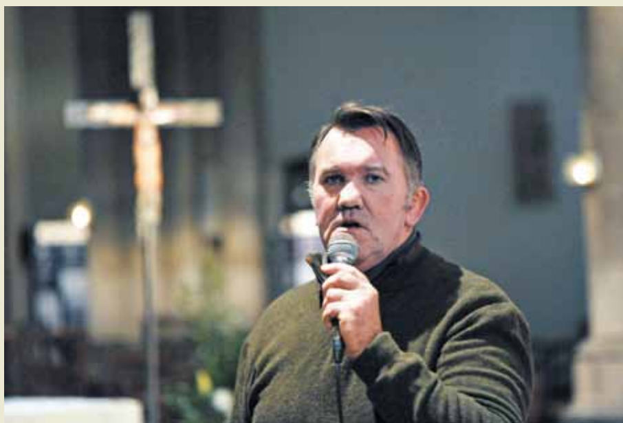
Lors de la Journée mondiale de prière et d'action pour les enfants organisée à Paris, en 2013, par le Bureau international catholique de l'enfance (BICE).

Tous les ans, plusieurs personnes en souffrance passent une année avec nous ou plus. Nous les logeons à côté de chez nous, les poussons à retrouver un