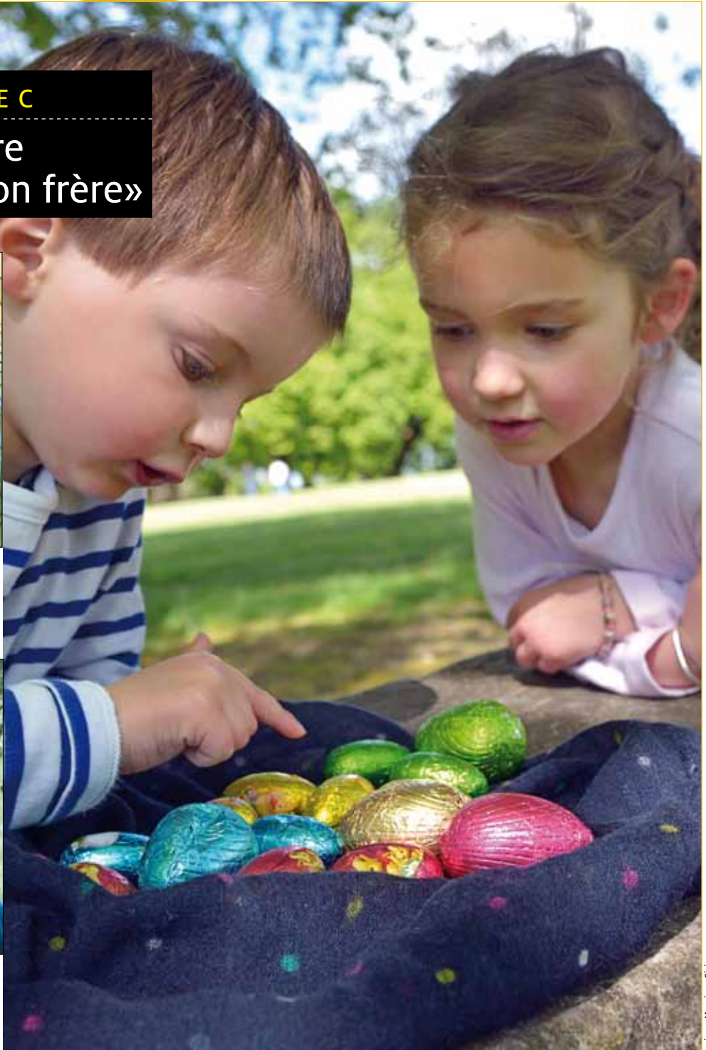
Enfants comptant des œufs de Pâques.

PAGE 11 : People Tim Guenard : «Le Big Boss arrive toujours à toucher les cœurs»