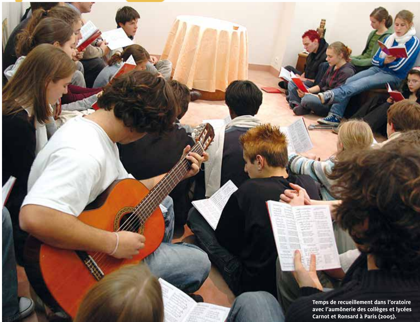
Temps de recueillement dans l'oratoire avec l'aumônerie des collèges et lycées Carnot et Ronsard à Paris (2005).