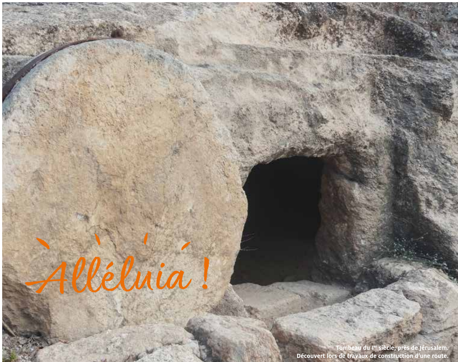
Tombeau du 1 er siècle, près de Jérusalem. Découvert lors de travaux de construction d'une route.