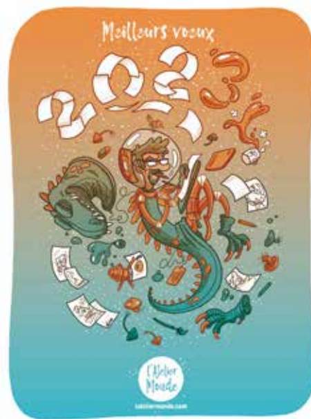
Carte de vœux réalisée par Nicolas.

Longue vie à Zoé et à son illustrateur !