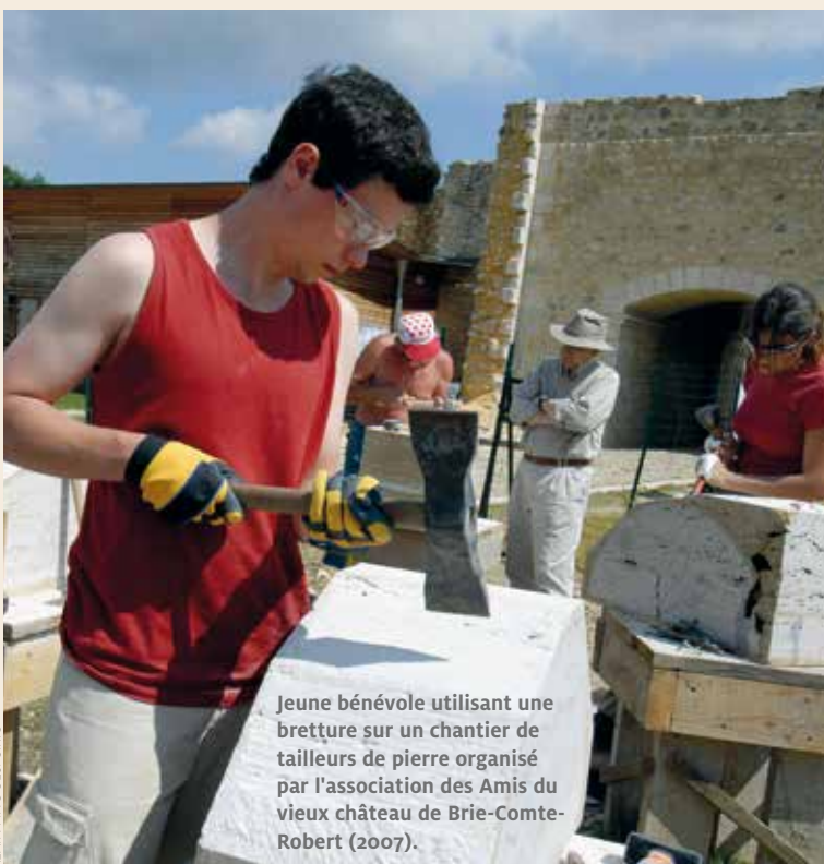
Jeune bénévole utilisant une brette sur un chantier de tailleurs de pierre organisé par l'association des Amis du vieux château de Brie-Comte-Robert (2007).

— Et le troisième de répondre avec un grand sourire : « Je taille des pierres pour construire la nouvelle cathédrale ! »